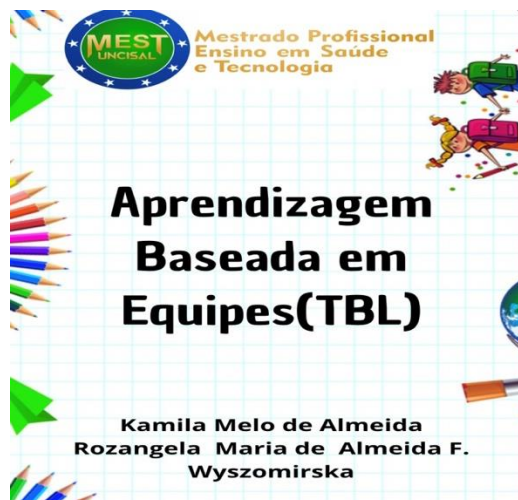
Figura 2 – Manual Interativo