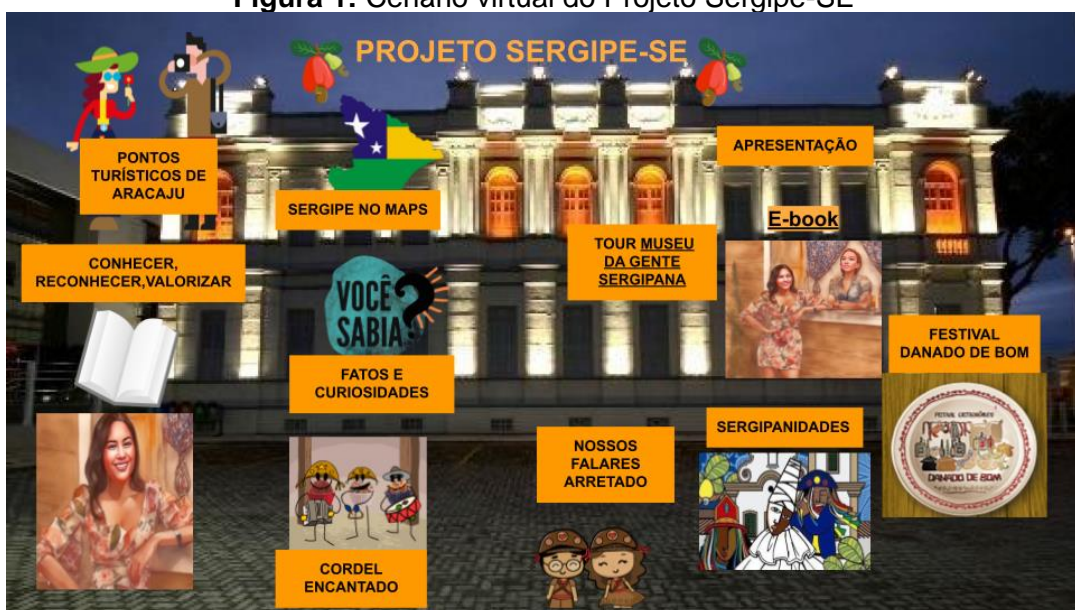
Figura 1: Cenário virtual do Projeto Sergipe-SE

A estrutura do material oferece uma abordagem abrangente e dinâmica, apresentando desde a culinária até o folclore, a literatura de cordel e os pontos turísticos. Além disso, a inclusão de sugestões de recursos adicionais e atividades práticas, como debates, trabalhos escritos e gamificação, elementos que enriquecem ainda mais a proposta, tornando-a contextualizada e envolvente para professores e alunos que desejam explorar a cultura de Sergipe. Com o objetivo de aprimorar a experiência de navegação no Cenário Virtual hospedado no Google Apresentações 7 , o qual incorpora uma rica gama de recursos. Observe a Figura 1: